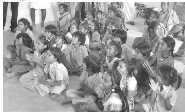
De kinderen van het Gypsie-project kunnen leren lezen en schrijven.

bezoeken enkele meisjes de middelbare school en heeft een jongen een hoge technische opleiding gevolgd en heeft hij een goeie baan buiten het dorp. Een zeer belangrijk onderdeel was de huisvesting. Stichting Pater Schlooz maakte samen met enkele bijzondere sponsors de bouw van 42 huisjes mogelijk. Deze vervingen de armzalige hutjes van stro en leem en beschermden de bewoners tegen zon, regen, ongedierte en wilde dieren. De eigen huisjes hadden ook een groot psychologisch effect, zij gaven de inwoners trots en zelfvertrouwen. Dit jaar werden de huisjes voorzien van individuele toiletten en werd nog een afvoerkanaal gebouwd. Daarmee is het huisvestingsproject voltooid. Met uw bijdragen, groot en klein, is hier een menswaardiger bestaan mogelijk gemaakt. De verdere ontwikkeling laten we nu over aan de goede zorgen van de Salesianen. Uiteraard zullen wij de ontwikkelingen blijven volgen en u daarover blijven berichten.