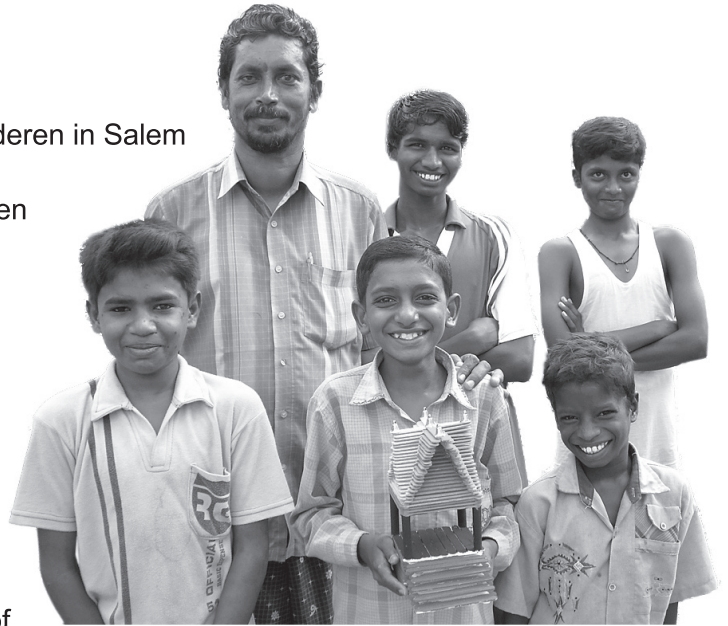
Een aantal van de met HIV/AIDS besmette kinderen in Salem, samen met een begeleider.

De volledige lijst van projecten die de stichting in 2009 heeft ondersteund treft u als bijlage aan. Voor hen die meer informatie wensen en over internet beschikken verwijzen wij naar: www.stichtingpaterschlooz.nl .